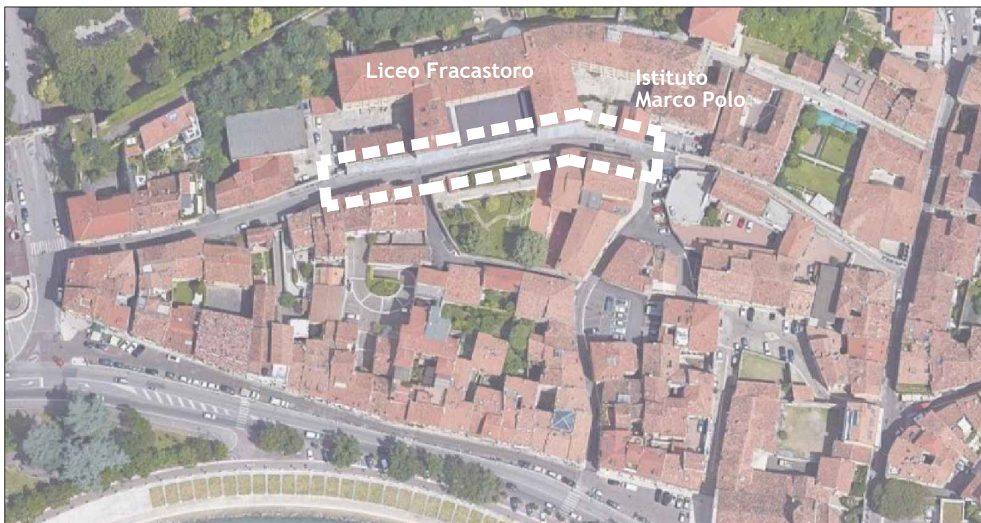
A. Ortofoto dell'ambito di intervento (Liceo Fracastoro e Istituto tecnico Marco Polo)

Richiesta di occupazione suolo pubblico (con chiusura strada)